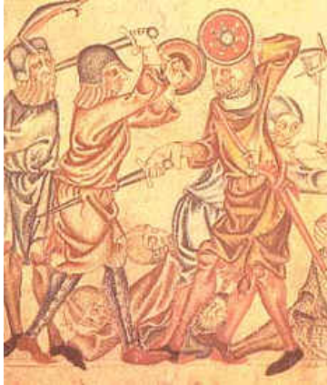
Пример применения средневековых меча и баклера в бою, из Холкхэмской Библии, начало 1300-ых