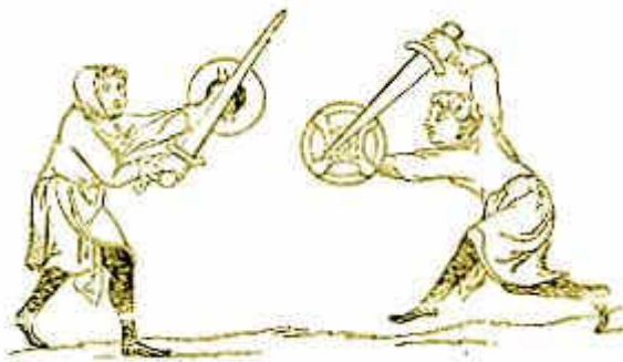
Выступление с мечами и баклерами, конец 1300-ых

Д-р Сингман также делает интересный вывод о том, что последняя последовательность неожиданно имеет единственное во всем манускрипте «женственное» название (« Walpurgis »). Он верит, что это может быть свидетельством того, что руководства предназначались для упражнений перед судебным поединком или разрабатывались на основе такого опыта.