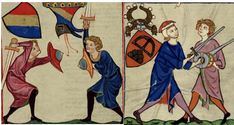
Поединки перед зрителями на мечах и баклерах. Кодекс Манессе, Германия, 1300-ые.